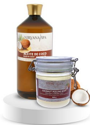
Peeling body 800 g. Ulei de masaj 1litru.