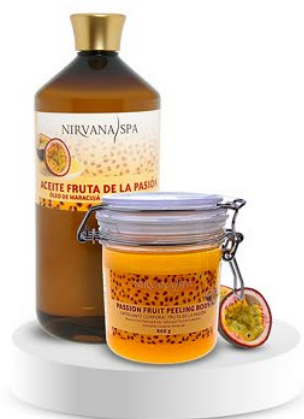
Peeling body 800 g. Ulei de masaj 1litru.