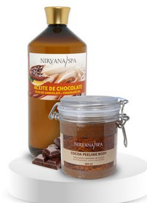
Peeling body 500 ml. Ulei de masaj 1litru.