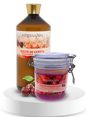
Peeling body 800 g. Ulei de masaj 1litru.