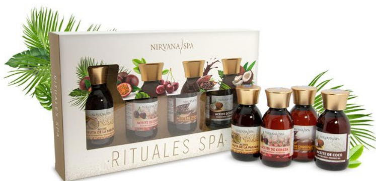
Vrei să te bucuri de toate Ritualurile Spa acasa?